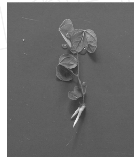
图 3、4 生根良好的南非羊蹄甲组培苗