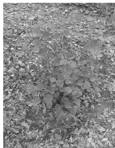
图 5、6 移栽成活的南非羊蹄甲组培苗