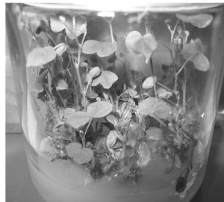
图 1.2 增殖状态的南非羊蹄甲组培苗